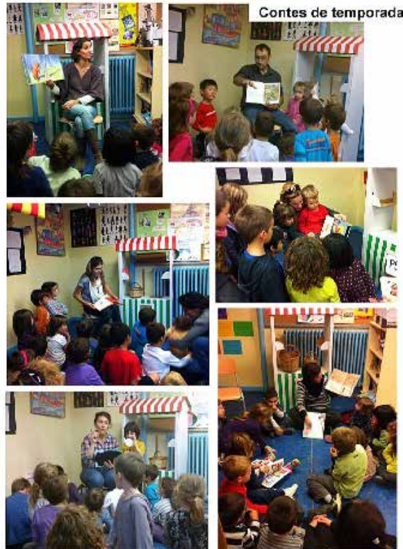
Contes de temporada