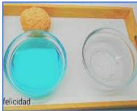
ESCÓRRER ESPONGES FINS QUE NO QUEDI AIGUA