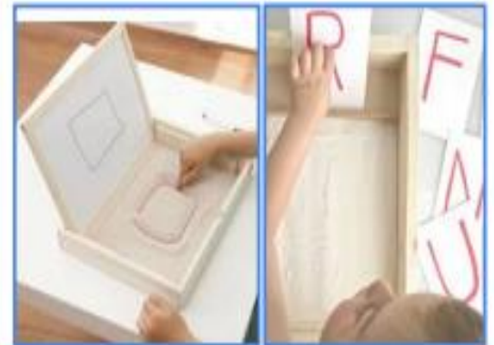
ESCRIURE LLETRES EN UNA SAFATA DE SAL/SÉMOLA/SUCRE