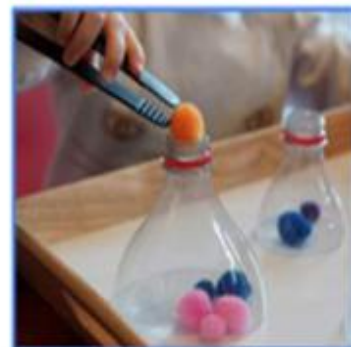
INSERIR POMPONS, CIGRONS.. EN AMPOLLES