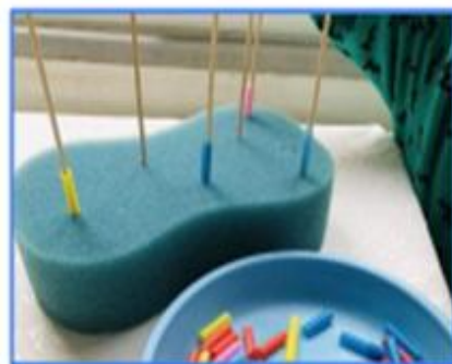
INSERIR CANYETES EN PALS CLAVATS EN ESPONGES