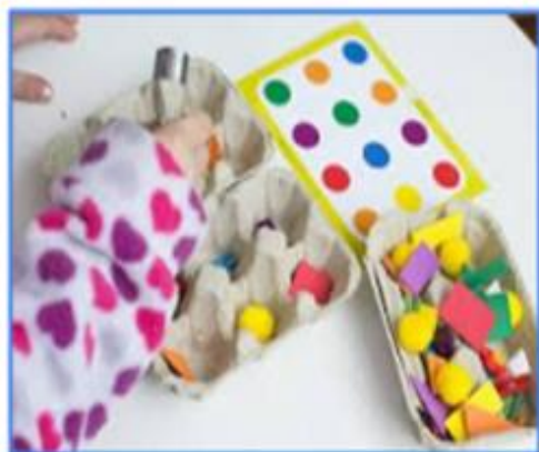
ACTIVITATS AMB QUERES (CLASSIFICAR COLORS, REGLETS...)