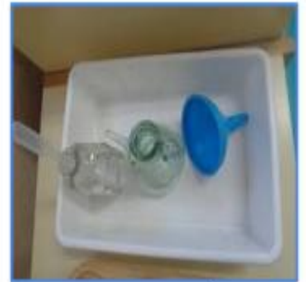
TRANSVASAR LÍQUIDS AMB EMBUTS