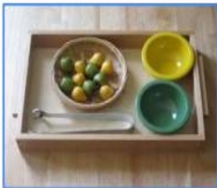
CANVIAR SÒLIDS D'UN RECIPIENT A L'ALTRE AMB PINCES