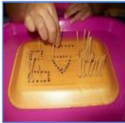
CLAVAR ESCURADENTS EN SAFATES D'ALIMENTS