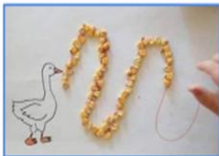
COL·LOCAR PEDRETES, CIGRONS, GRANS DE BLAT... SOBRE UNA LÍNIA