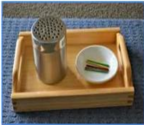
INSERIR ESCURADENTS EN POTS AMB FORATS